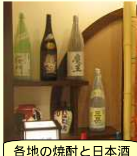
各地の焼酎と日本酒

帰りがけに見ると、通が好みそうな各地方の焼酎と日本酒を飾ってありました。次回は、夜に来てみたいものです。