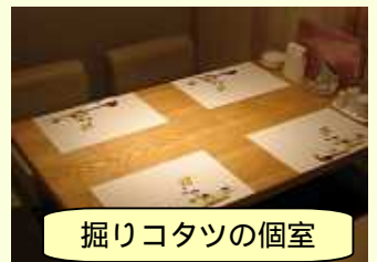
掘りコタツの個室

仲間どうしがたまに会って、ランチを食べながら楽しくおしゃべりをするには、最適だと思います。