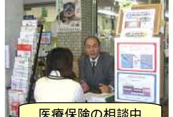
医療保険の相談中

問い合わせはほとんどないのですが、気にしている方は結構いるようで、通りすがりに多くの方がパネル等を見ていました。おそらく、一生涯に1千万円以上も支払う大きな買い物だからでしょうね。