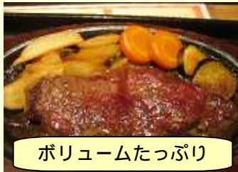
ボリュームたっぷり

ランチメニューもリーズナブルで、日替わりランチが700円前後、量は女性向。大食漢の私は980円の