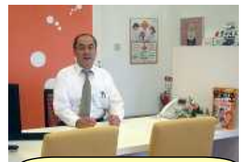
みんなの保険プラザの相談スペースで撮影