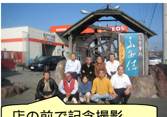
店の前で記念撮影

翌日の出発前に店の前で、記念撮影。帰りには、シシャモ祭りの会場へ行ってお土産のシシャモを買ってきた。帰ってきてから早速シシャモを焼いて「さすがに本場のシシャモは旨いねえ」と言いながら妻と二人でたべました。本当に楽しい秋の2日間で